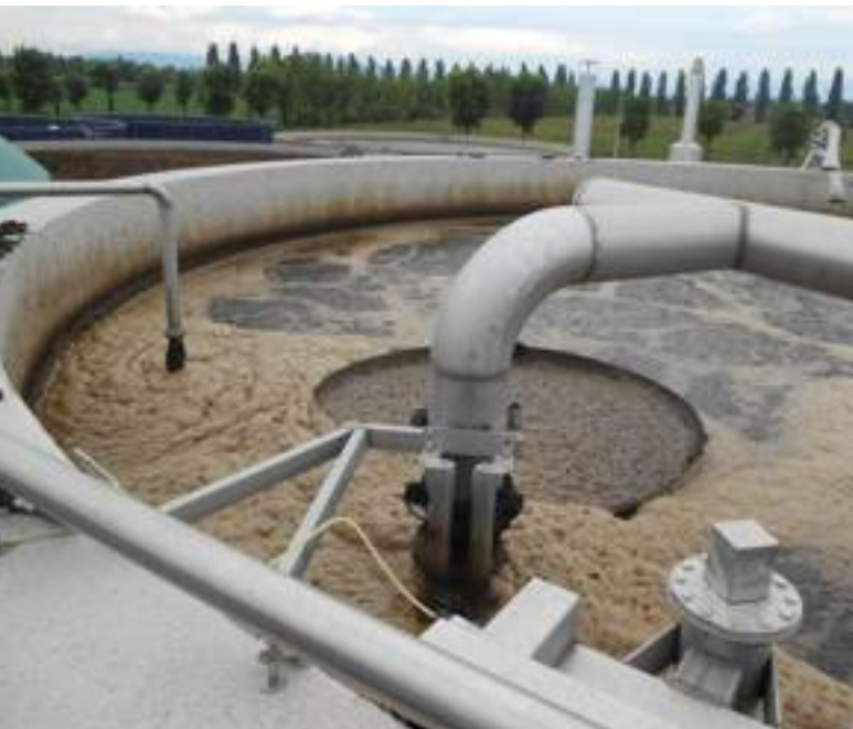
Il trattamento del liquame contenuto nella vasca interna. Qui avviene la nitrificazione: l'azoto ammoniacale tramite ossidazione biologica diventa nitrato.