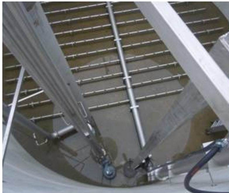
La vasca interna, qui vuota perché ripresa durante gli ultimi momenti della sua costruzione. In evidenza, alla base della vasca, i soffiatori.

tubo flessibile e riavvolgibile si collega a un ripuntatore e questo inietta i liquami nel terreno, in accordo con gli orientamenti agronomici più avanzati in materia di distribuzione eco-