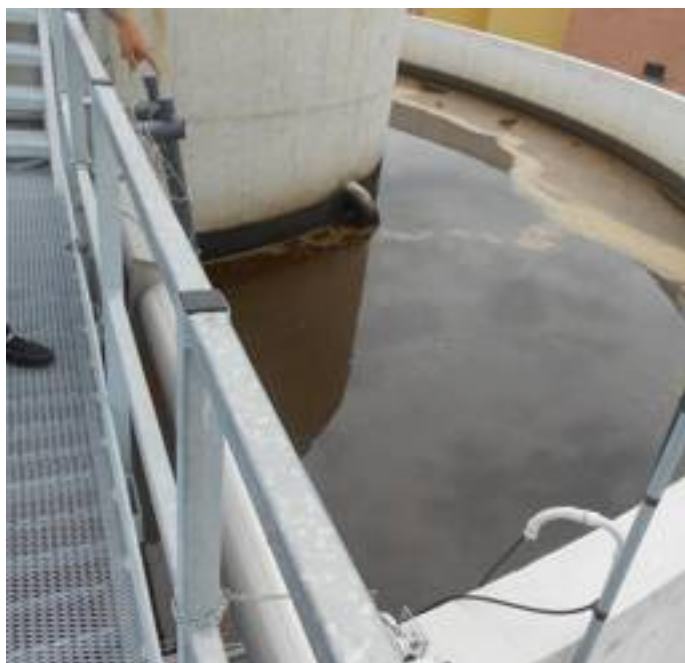
La vasca esterna, dove avviene la denitrificazione.

l'azienda Pigliaquaglie. Qui l'impianto di abbattimento dell'azoto del digestato, che utilizza la tecnica nitro-denitro, consiste in un'originale doppia vasca: due grandi vasche cilindriche concentriche, quella al centro per la nitrificazione degli effluenti, quella esterna per la denitrificazione. L'impianto, realizzato dalla ditta Gong di Ghedi (Bs), raggiunge il proprio obiettivo dell'abbattimento dell'azoto a fronte di costi di funzionamento particolarmente contenuti grazie alla particolare forma geometrica delle vasche: i consumi di energia elettrica, sottolinea l'imprenditore, sono pari a soli 6 Kw/mc, meno di un euro al metro cubo. Almeno due sono i fattori che rendono particolarmente performante questo originale disegno delle vasche. Il primo risiede nel fatto che nell'anello