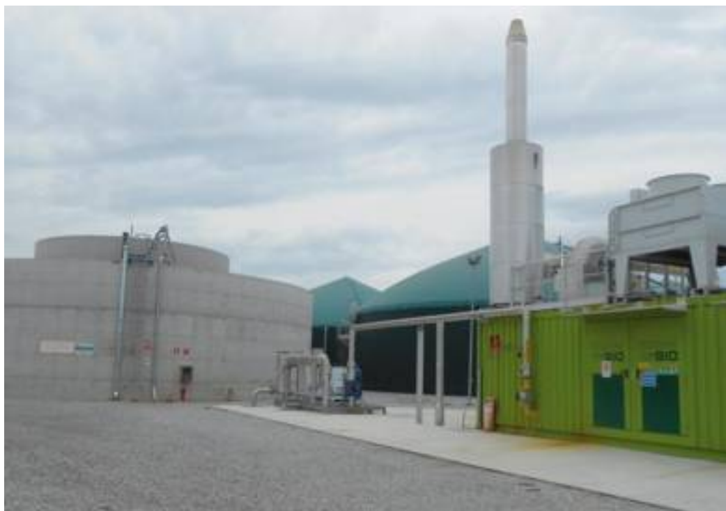
L'impianto biogas dell'azienda mantovana. Sulla sinistra le due vasche concentriche per il trattamento del digestato.

venti di un impianto biogas, perché il problema del rispetto della direttiva nitrati è stato risolto in modo brillante, con soluzioni gestionali e tecniche d'avanguardia, perché con queste condizioni diventa possibile anche progettare un ampliamento dell'allevamento. Tutto questo per di più all'interno di dimensioni produttive