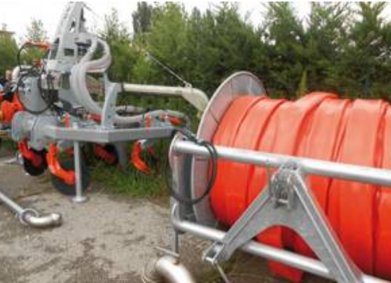
Nelle tre foto, la macchina acquistata da Boldini per la distribuzione in campo dei liquami. Si tratta di un interruttore di liquami Doda, che sarà trainato da un trattore. Durante il lavoro in campo, verrà raggiunta dai liquami tramite la grossa tubazione arancione.